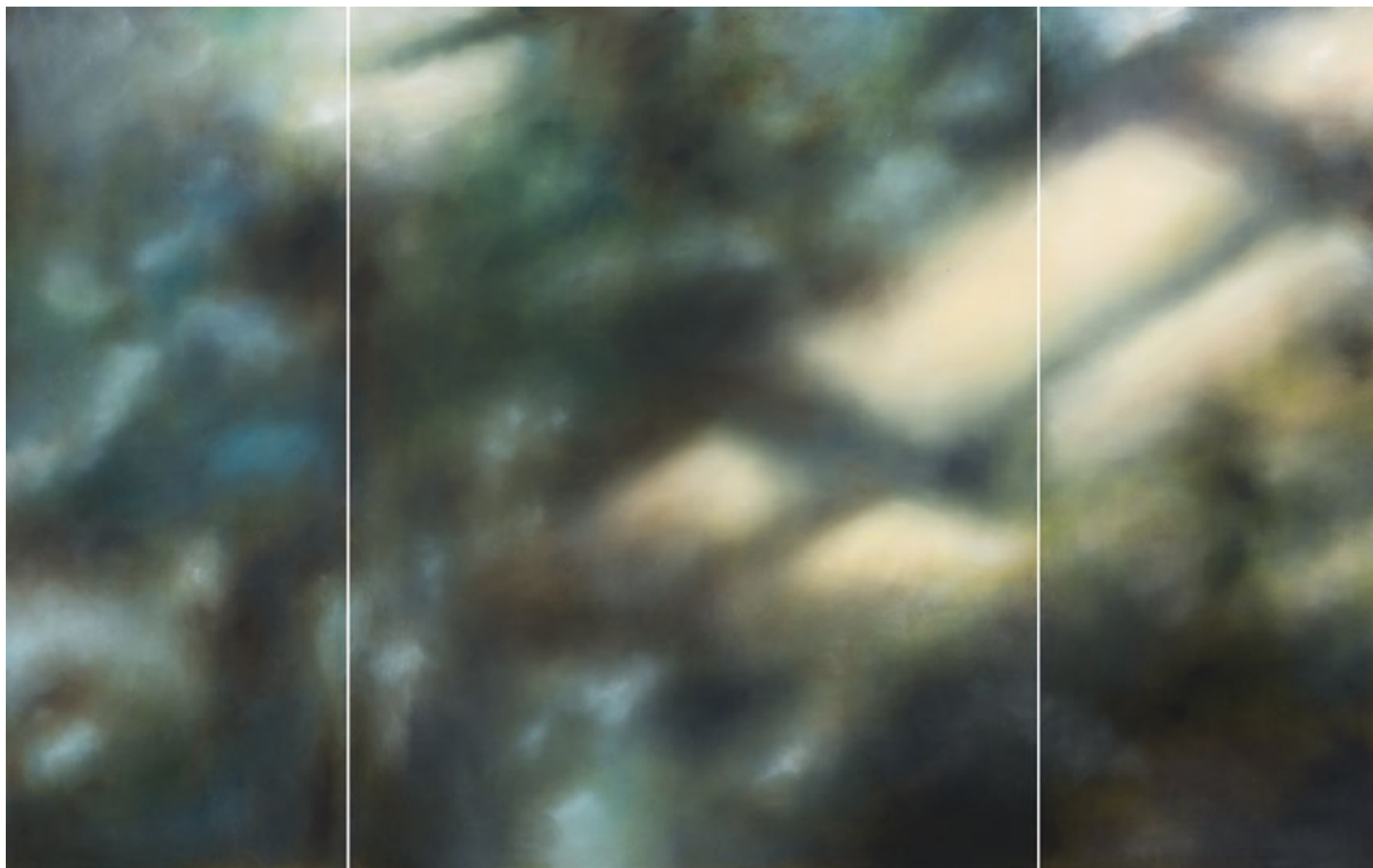
Paradise Circus II Oil on canvas, 2019 160 x 240 cm