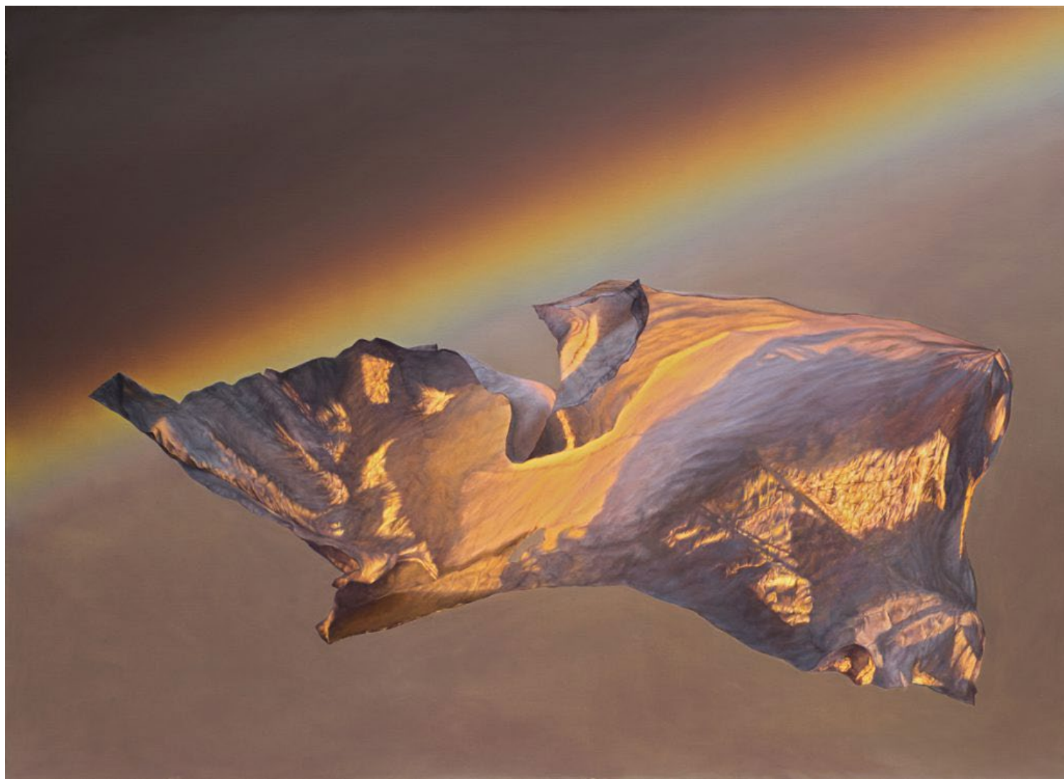
White Flag Oil on canvas, 2015 130 x 180 cm