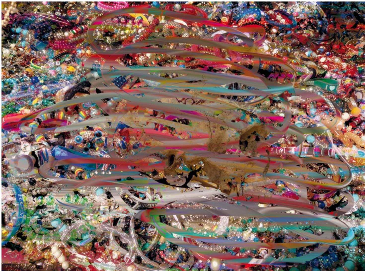
30-20-02 Accelerated Evolution Trash table for jewelry, skull Fine art print, dibond, 2019