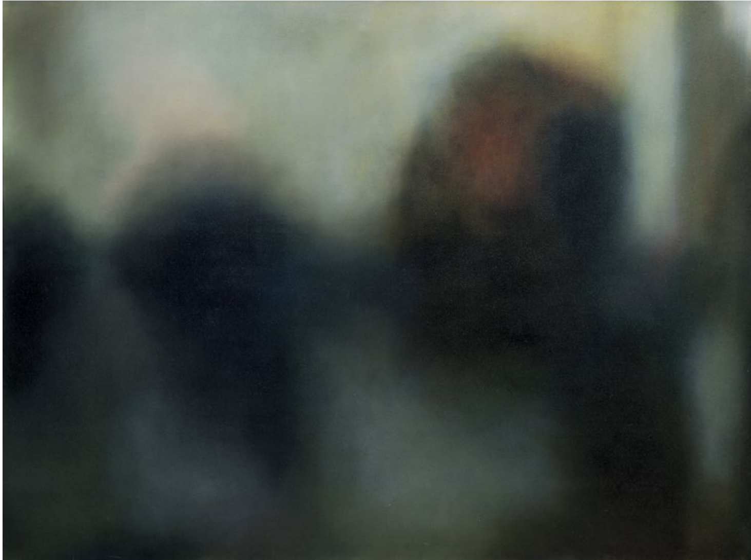
Mirando I Oil on canvas, 2016 120 x 160 cm