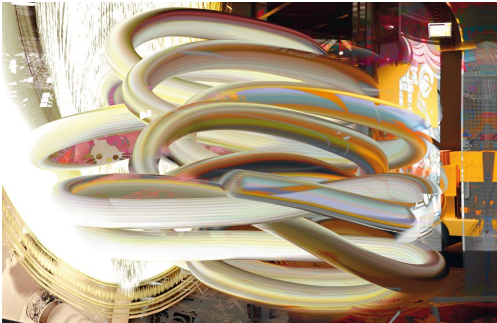
28-03-03 Accelerated Paradise Game room in Japan, duty free shop, hotel lobby Fine art print, dibond, 2018