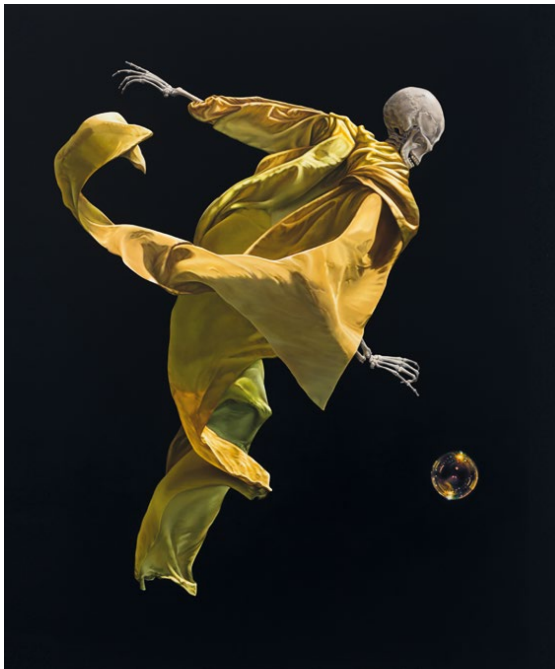
Transmitter Oil on canvas, 2019 210 x 170 cm