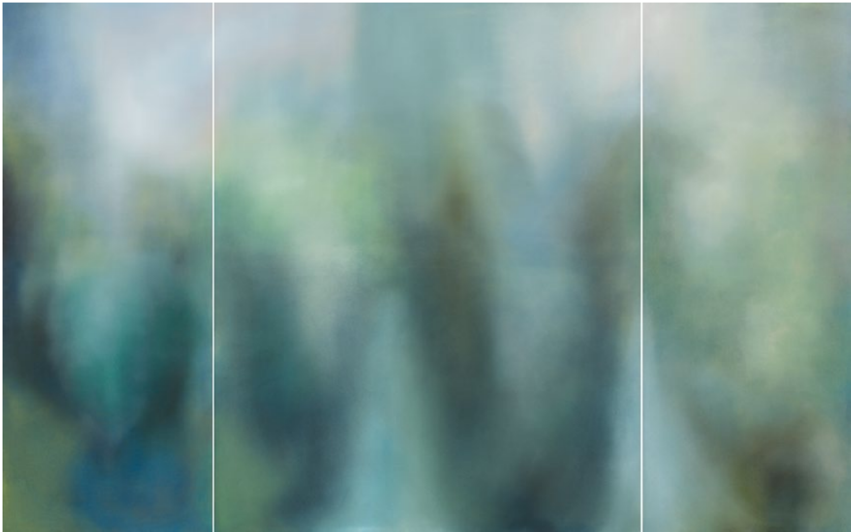
Paradise Circus I Oil on canvas, 2019 160 x 240 cm