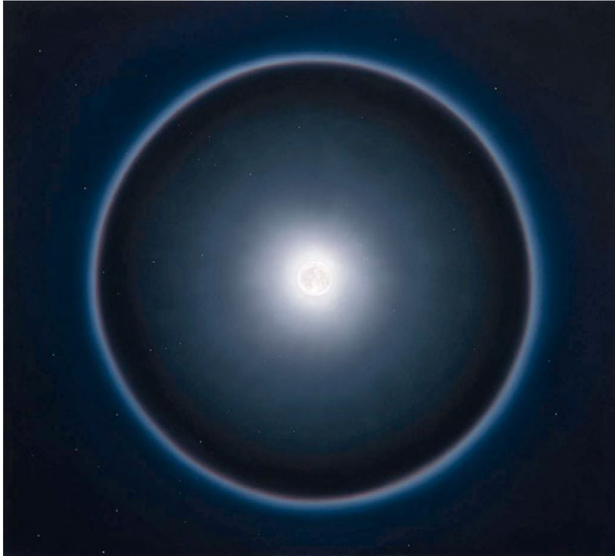
Halo Oil on canvas, 2019 90 x 100 cm