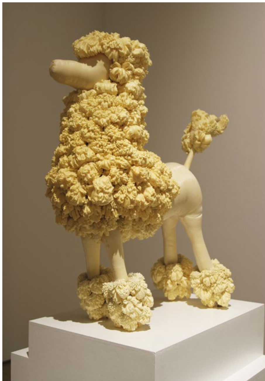
Poodle Mixed media, 2010 75 x 60 x 28 cm