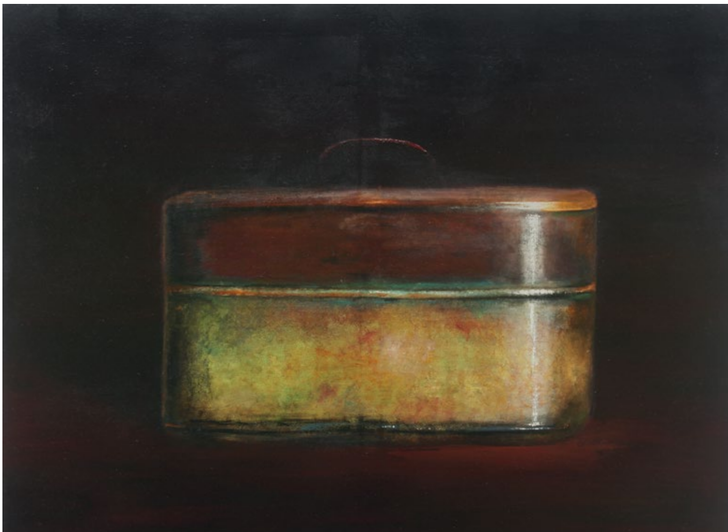
Magic Lamp 1 Oil on canvas, 2018 120 x 160 cm