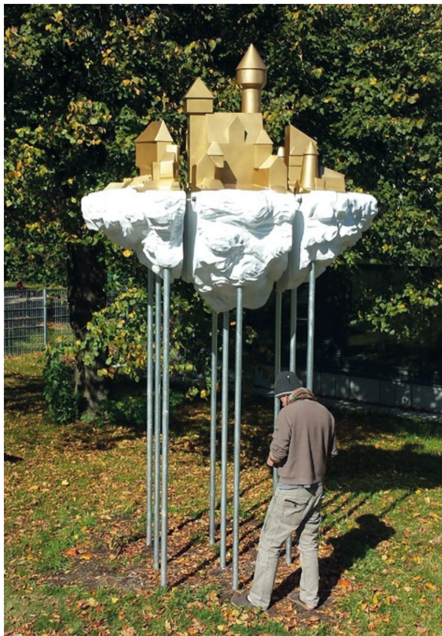
Castle In The Air Mixed media, 2017 420 x 220 x 155 cm