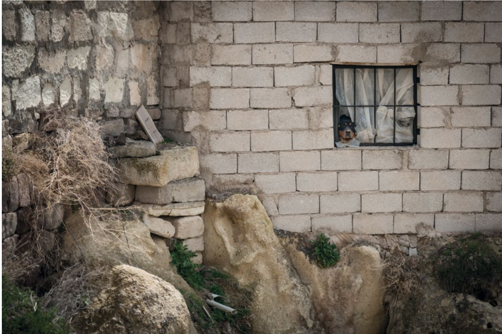
Waiting While Hoping Cappadocia, print on painted aluminum, 2017 100 x 150 cm