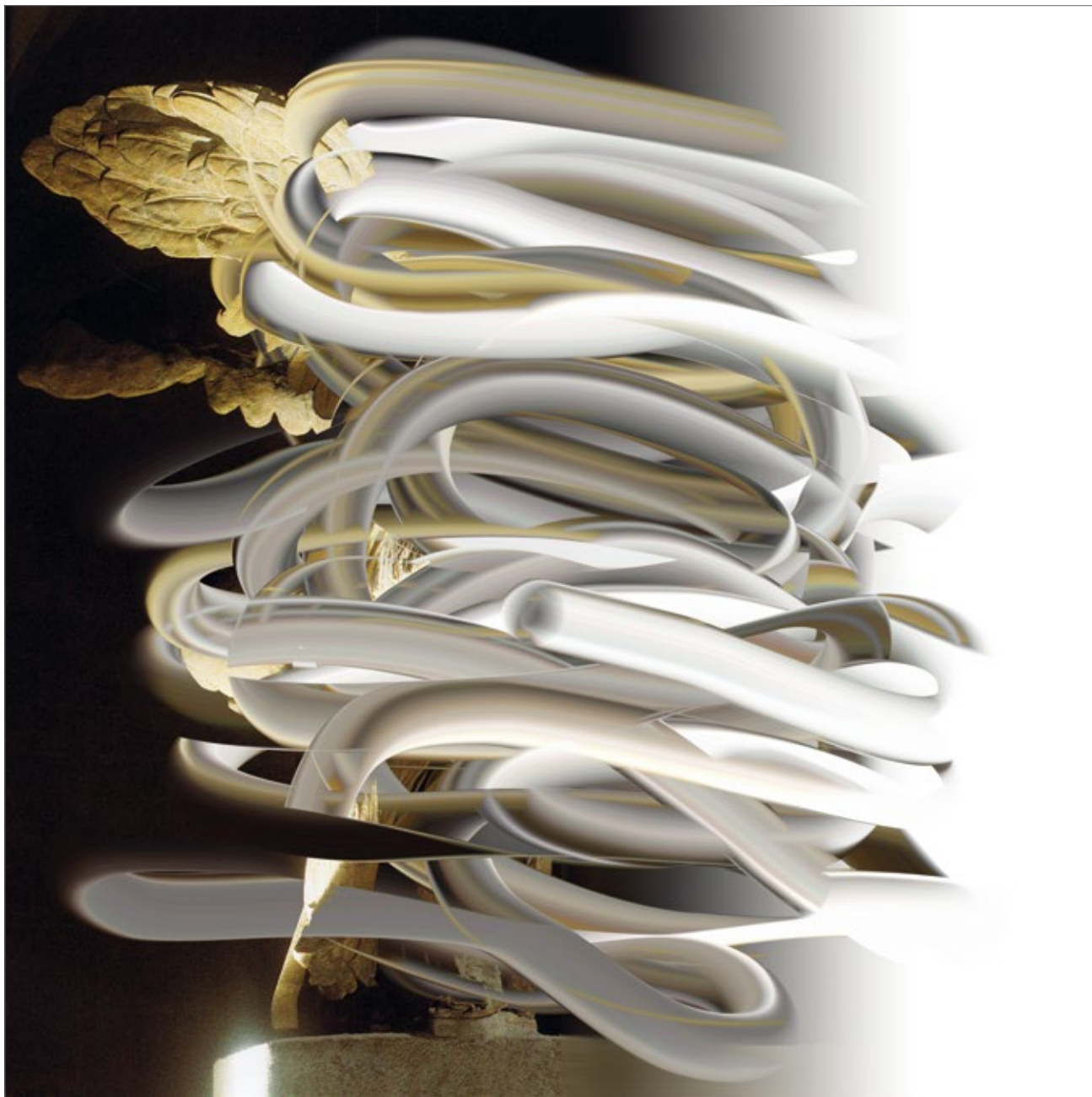
32-03-09 Accelerated Paradise Antique angel statue Fine art print, dibond, 2018