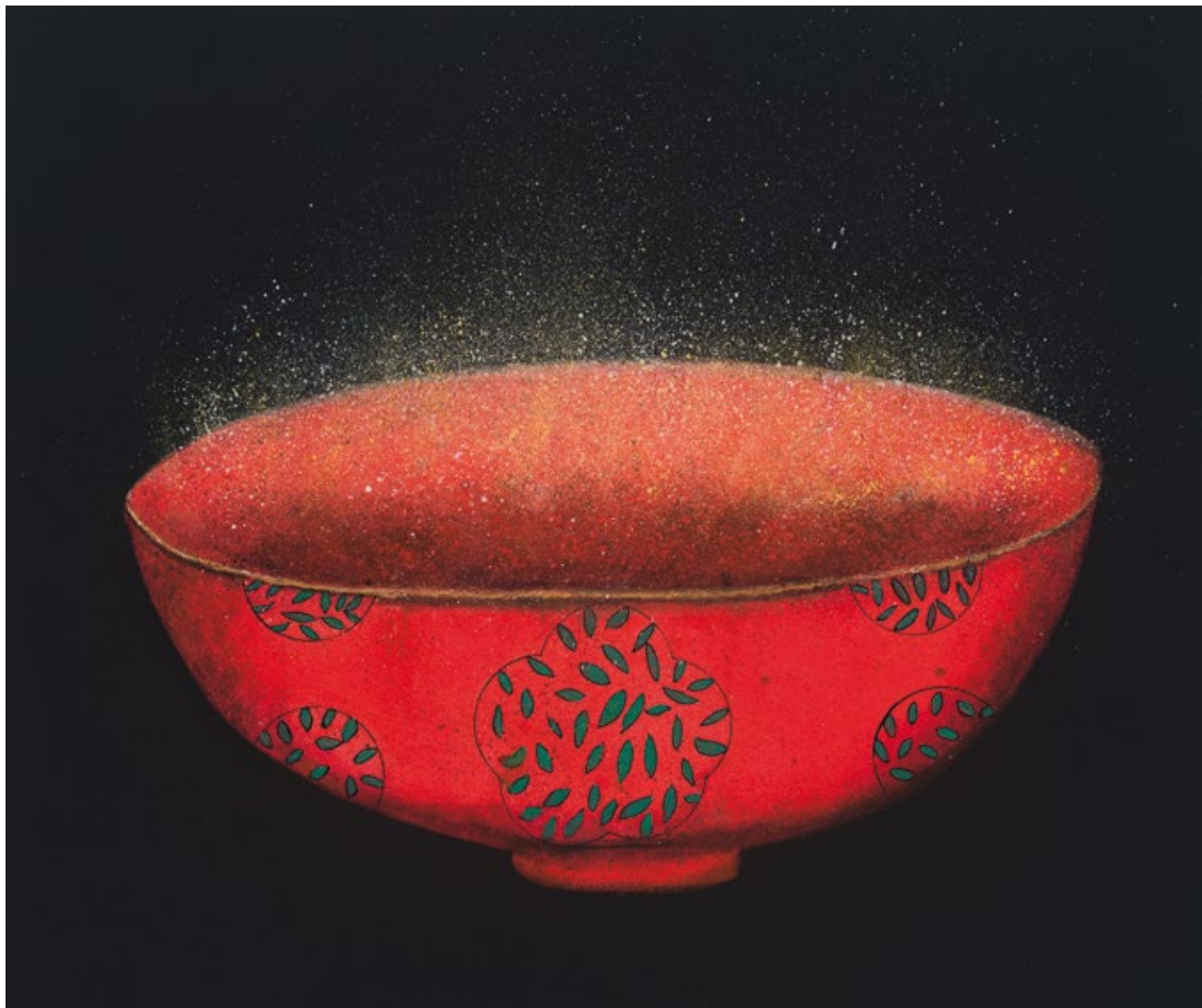
Magic Lamp 2 Oil on canvas, 2018 120 x 160 cm