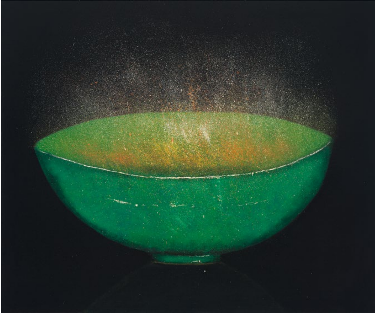
Magic Lamp 3 Oil on canvas, 2018 120 x 160 cm