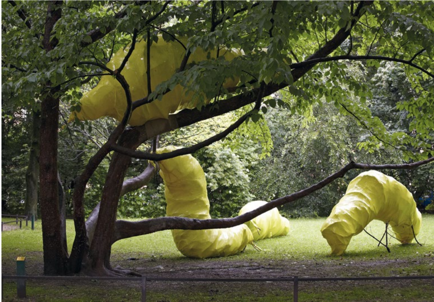
Mass Confrontation Mixed media, 2013